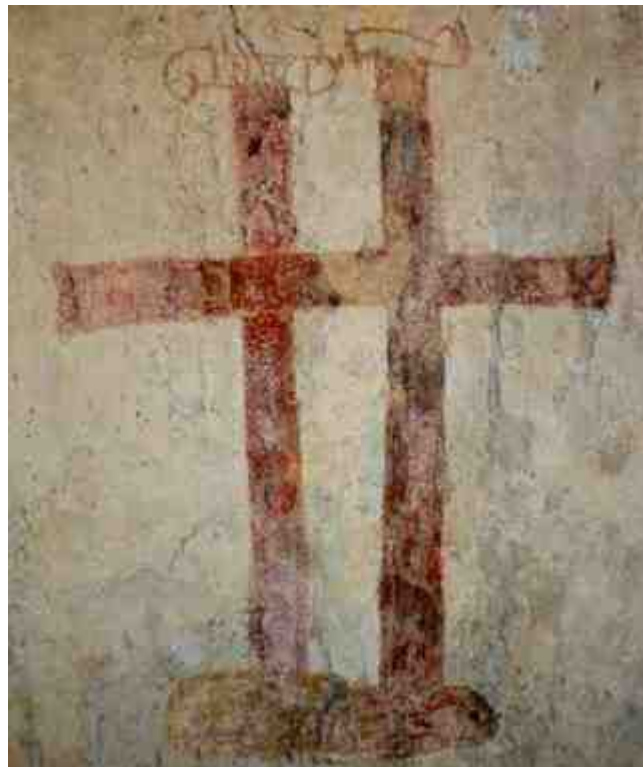
Double croix du plafond de l'église de Serres suggérant l'existence des 2 Jésus (Sauveurs)