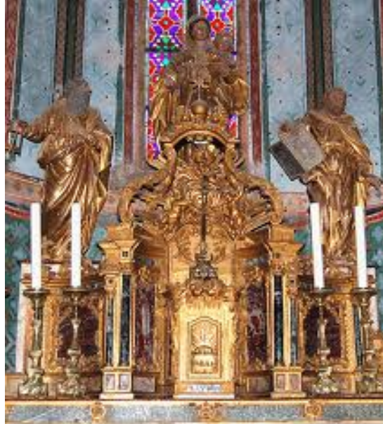
Autel basilique Notre Dame de Marseille

La solution de l'énigme est dévoilée sur l'autel ; à coté d'une statue géante de St Pierre se reconnaissant à ses clefs, se trouve (alors qu'on s'attendait à une statue de St Paul reconnaissable à son épée) une statue de St Luc tenant un livre ouvert (= MONTRE) à la main.