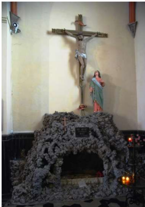
La statue du Christ VIVANT, debout a été remplacée par les faussaires !

Suite à mes révélations, le Christ debout a été enlevé et substitué par un autre personnage et les faussaires de l'Histoire ont également remplacé le crucifix.