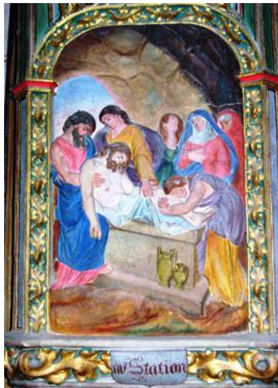
A la 14 ème station, Jésus toujours vêtu de rouge et bleu PORTE le crucifié qui est un AUTRE.