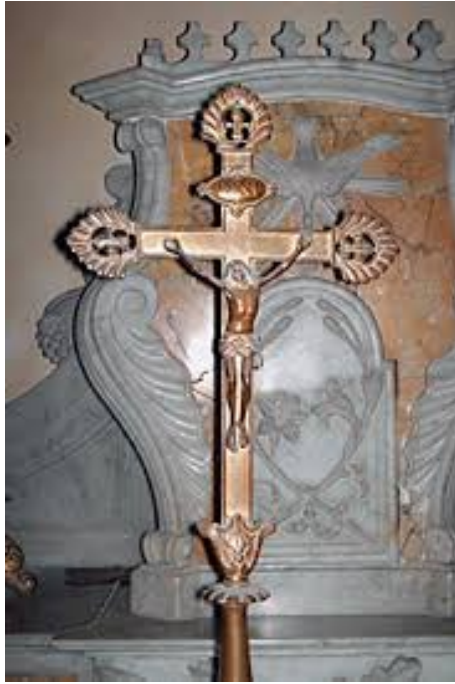
Ce crucifix posé sur l'autel avec l'inscription I.R.N.I. a été remplacé par les faussaires !