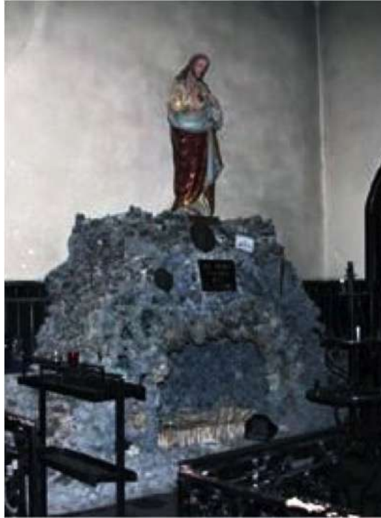
Christ VIVANT, debout au-dessus de la grotte (Jésus Barabbas)

Suite à mes révélations, le Christ debout a été enlevé et substitué par un autre personnage et les faussaires de l'Histoire ont également remplacé le crucifix.